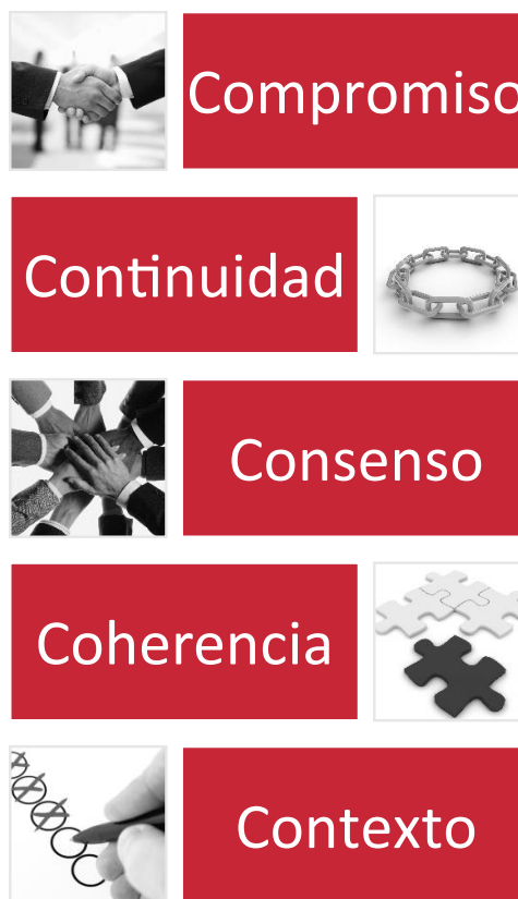
Diagrama I: Requisitos para una sociedad innovadora

Movernos en la dirección de ser una sociedad innovadora requiere lo siguiente: